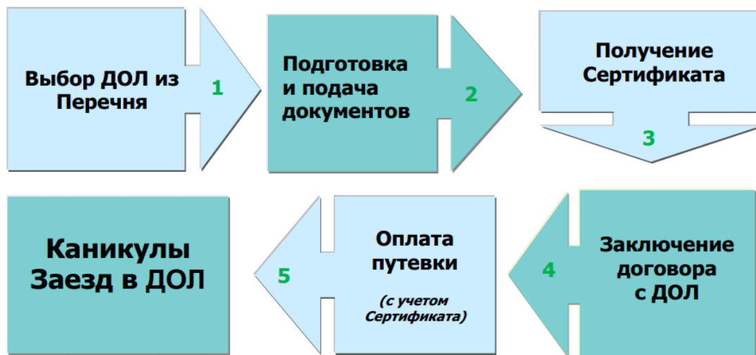
Рисунок 1. Порядок приобретения путевок в ДОЛ в Санкт-Петербурге.

Порядок приобретения путевок в детские оздоровительные лагеря (далее – ДОЛ) для детей работающих граждан представлен на рис. 1.